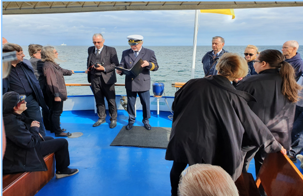
Der Kapitän leitete die Seebestattung ein und verlas die Koordinaten