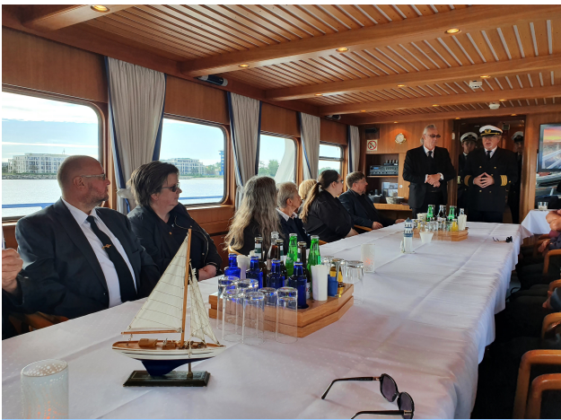
Begrüßung durch den Kapitän an Bord der MS „Merkur II“ zur Seebestattung